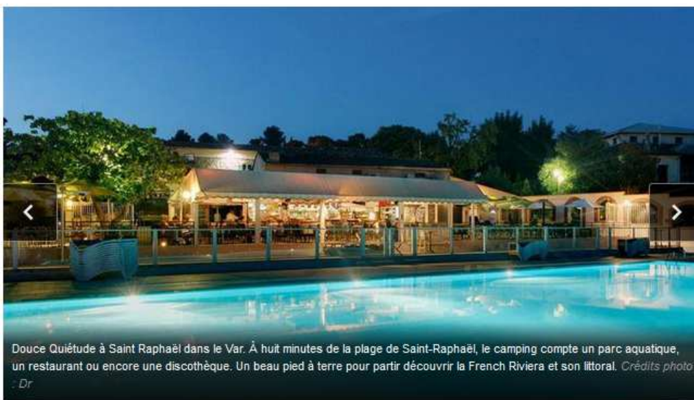
Douce Quiétude à Saint Raphaël dans le Var. À huit minutes de la plage de Saint-Raphaël, le camping compte un parc aquatique, un restaurant ou encore une discothèque. Un beau pied à terre pour partir découvrir la French Riviera et son littoral.