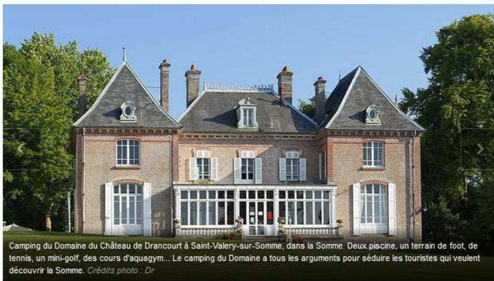
Camping du Domaine du Château de Drancourt à Saint-Valery-sur-Somme, dans la Somme. Deux piscine, un terrain de foot, de tennis, un mini-golf, des cours d'aquagym... Le camping du Domaine a tous les arguments pour séduire les touristes qui veulent découvrir la Somme.

Les campings font peau neuve! Ils disposent de somptueuses piscines, de terrains de (mini) golf, de tennis, d'accrobranche et d'un confort qui n'a parfois rien à envier aux hôtels standards: l'heure du camping de luxe a sonné. Le secteur est une véritable manne pour les audacieux. Selon les chiffres de la FFCC 1 (fédération française des campeurs, caravaniers et camping-caristes), la France serait l'eldorado du camping: c'est la première forme d'hébergement touristique. Symbole d'un changement des mentalités, 80 % des Français pensent que le camping est un mode de vacance comme les autres.